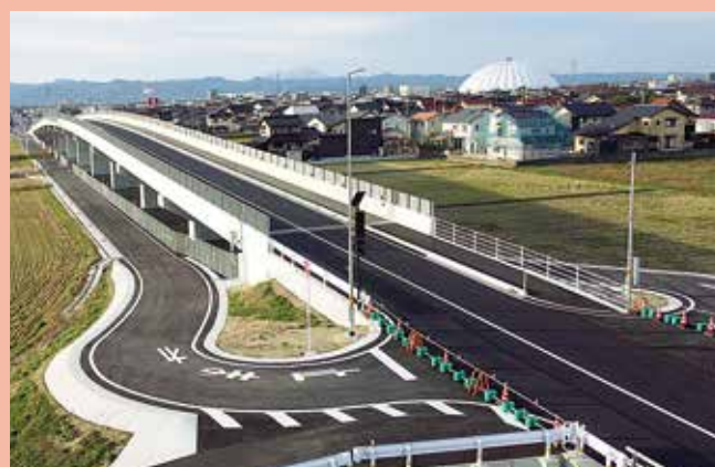
矢尾今市線(出雲市)