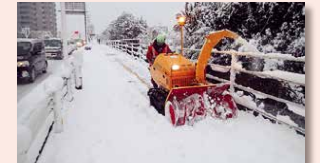
懸命の除雪作業で生活路線を守る