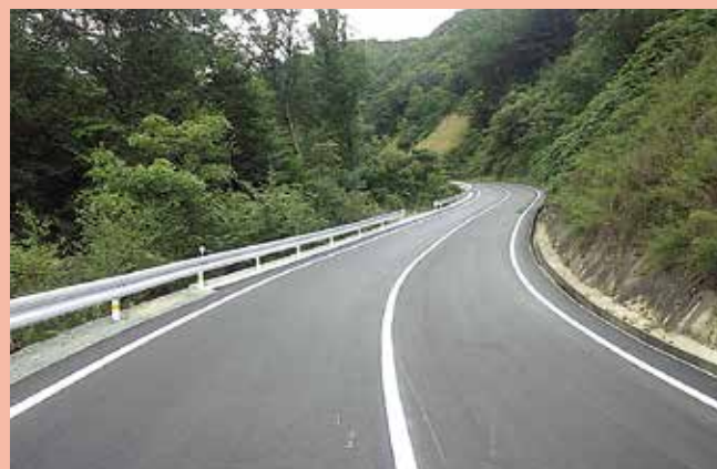
広域基幹林道金城弥栄線(浜田市)