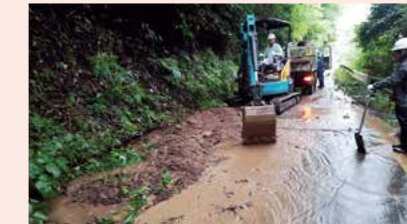
舗装工事だけではなく災害復旧工事も行なっています