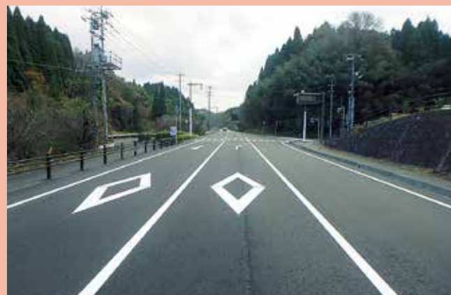
仁摩邑南線(大田市)