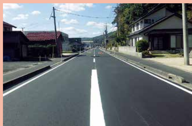
松江木次線(雲南市)