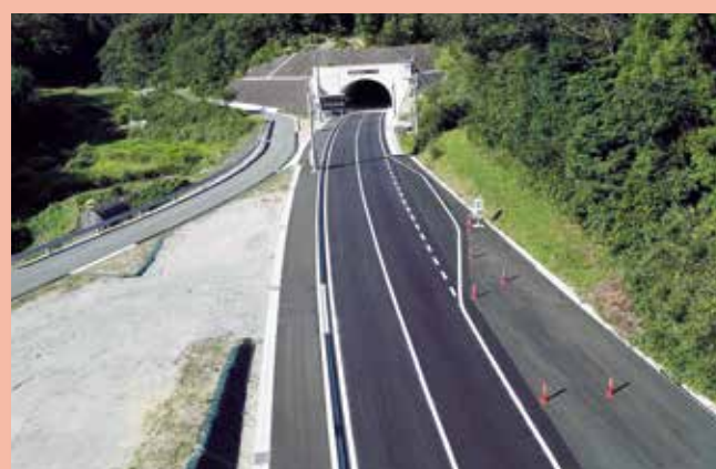
大野魚瀬恵曇線(松江市)