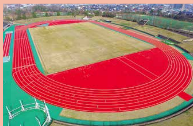
松江市宮陸上競技場(松江市)