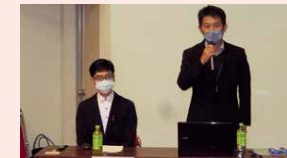
週休2日工事及びICT舗装工事研修会