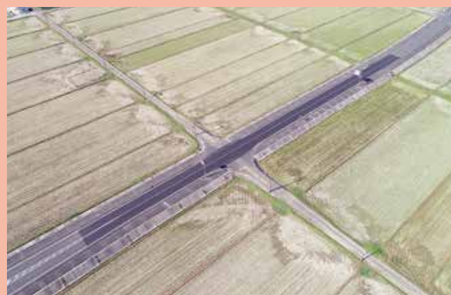
木次直江停車場線(出雲市)