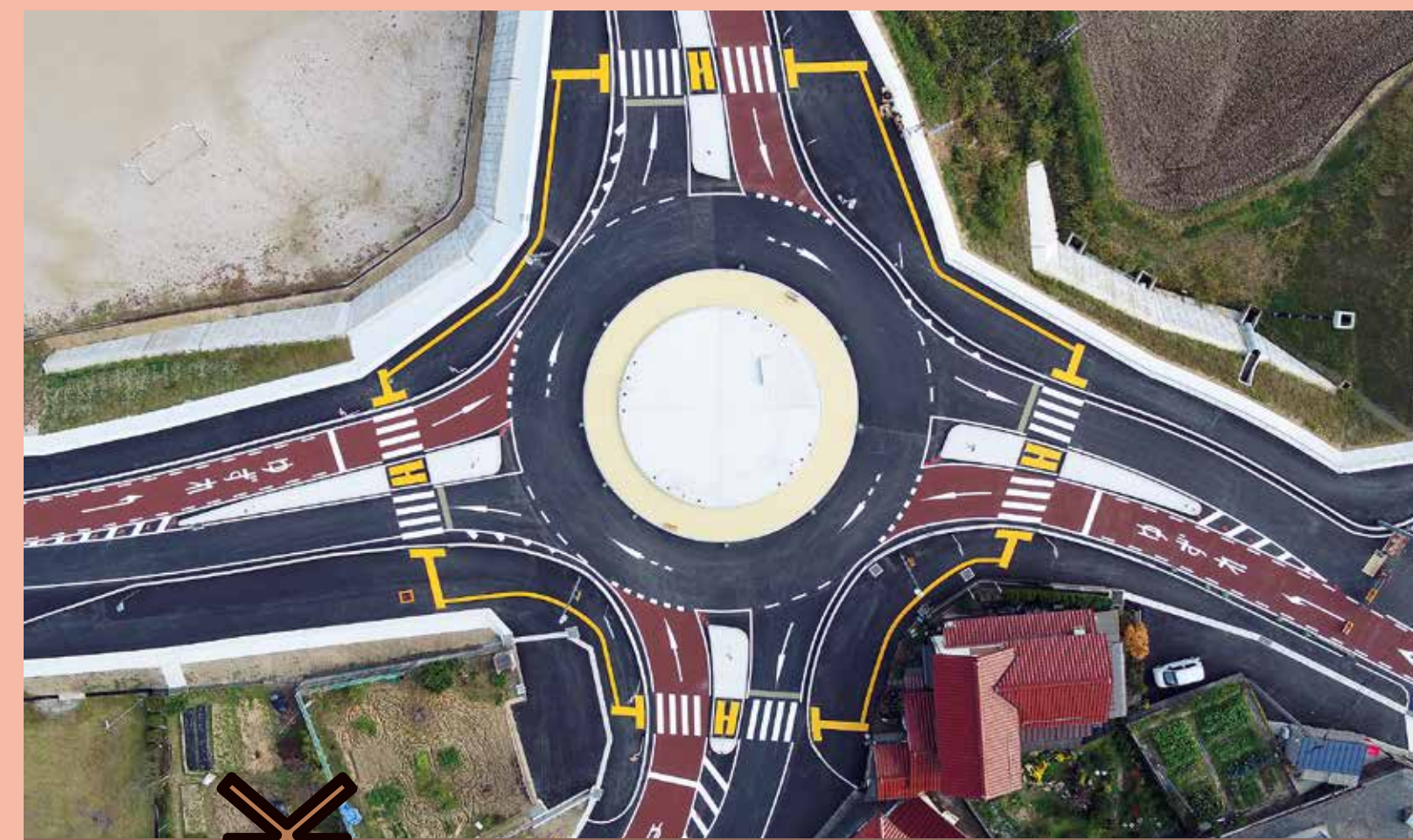
浜田八重可部線(浜田市)